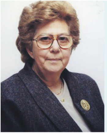
Η αείμνηστη και αξεχαστη δασκάλα, αγωνίστρια και όχι μόνο, Κλεάνθη Αγγελίδου, υπηρέτησα και ως Υπουργός Παιδείας και Πολιτισμού της Κύπρου.

ώματα και το δικό της "συνιστών κράτος" ως αποτέλεσμα μιας εισοβολής που έγινε παραβιάζοντας το διεθνές δίκαιο;».