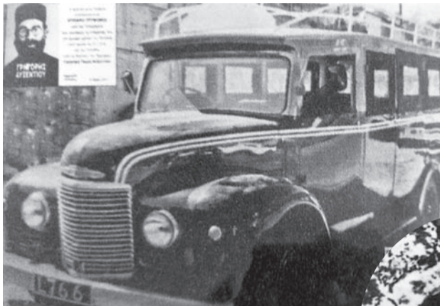
Το αυτοκίνητο L766 του Κυριάκου Τρύφωνος, με φόντο φωτογραφία του Αυξεντίου.

«Μόλις νύκτωσε, 14 Μαρτίου 1956, ο Αυξεντίου, με την ομάδα του, ήταν όλοι 15, έφθασαν στην Ποταμίτσα προερχόμενοι από τον Άγιο Θεόδωρο Αγρού, μέσω Άν Γιάννη. Επειδή ήταν πολλοί, οι περισσότεροι έμειναν στο σπίτι του Παπά Αγαθοκλή και 4-5 στο σπίτι μου. Την άλλη μέρα, μόλις νύκτωσε, με ειδοποίησε ο Αυξεντίου να παραλάβω όλους τους αντάρτες και να τους πάρω με το αυτοκίνητό μου στα Χαντριά. Σε λίγο ήταν όλοι έτοιμοι. Ανέβηκαν στο αυτοκίνητο και έβαλα μπροστά. Όταν φθάσαμε στις Δύμες, βρήκαμε άλλο αυτοκίνητο σταματημένο στη μέση του δρόμου. Δεν μπορούσαμε να προχωρήσουμε, διότι ο δρόμος ήταν στενός. Ο Νικόλας