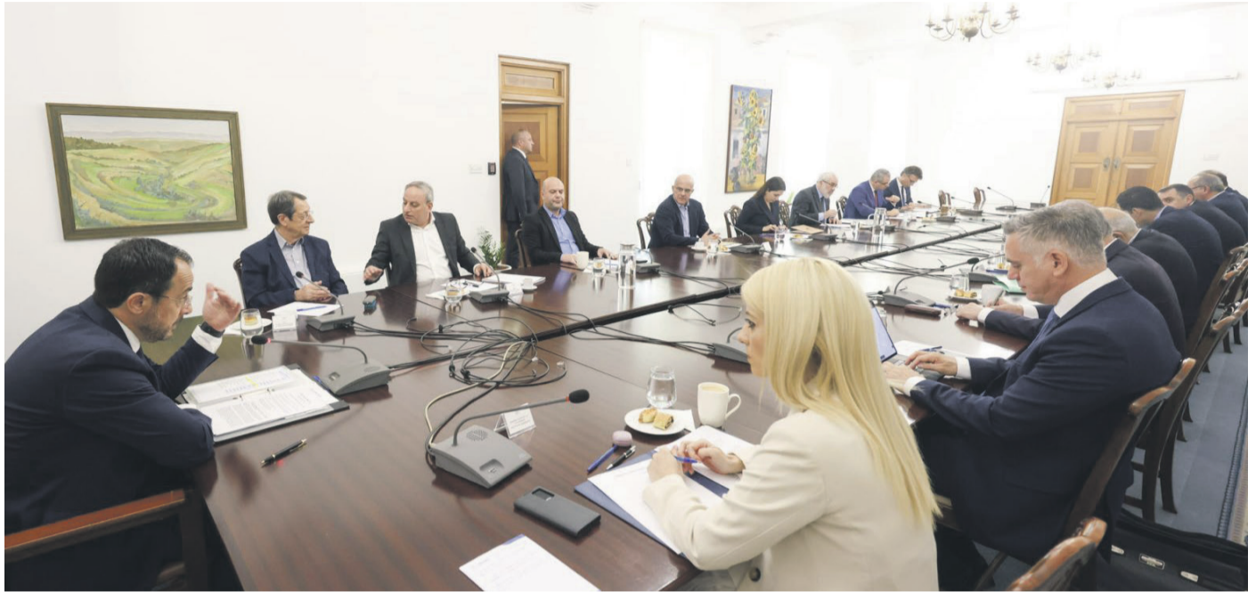
Συνεδρίαση Εθνικού Συμβουλίου, Παρασκευή, 26 Απριλίου 2024, στο Προεδρικό Μέγαρο, υπό την προεδρία του ΠτΔ, Ν. Χριστοδουλίδου.

- Με την αθεράπευτη πλάνη και αδιαστική πλέον ψευδαίσθηση πως, τάχα μου, οι οιστηρλατούμε- νοι από τον νεο-οθωμανικό επε- κτατισμό τους επιβουλεύόμενοι «ξαφνικά ένα βράδυ» και τα νησιά μας στο Αιγαίο, θα... ευαρεστηθούν να τερματίσουν την παράνομη κι απώρονη έως σήμερα κατοχή των βορείων ελληνικών εδαφών της Κύπρου. Για να μοιραστούν, νομί-