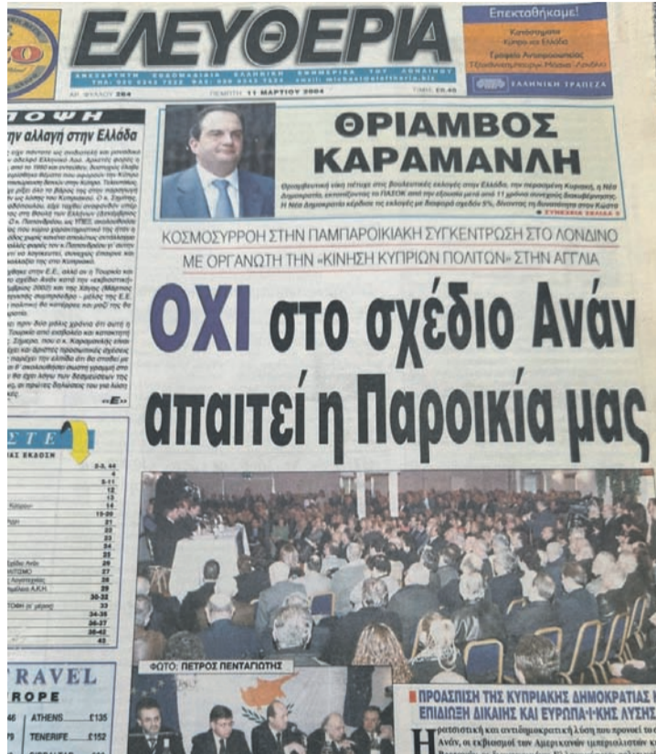
Πρωτοσέλιδο, 11.3.2004, της «Ελευθερίας».