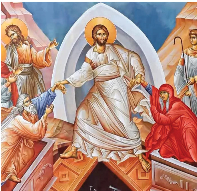
Καλό Πάσχα και Καλή Ανάσταση σε όλον τον κόσμο. Υγεία, χαρά και ειρήνη απ' άκρη σ' άκρη!