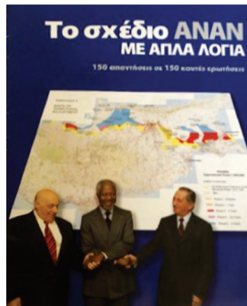
Η εφημερίδα «Σπερμινή» τον Μάρτιο του 2004, που μαζί με τον «Αντένα» Κύπρου και τον «Φιλελεύθερο» πρωτοστάτησαν στην απόρριψη του «Σχεδίου Ανάν», κυκλοφόρησε αυτό το άμεσα ενημερωτικό ένθετο με 150 ερωτήσεις και 150 απαντήσεις.

Πέραν των ενεργειών της «Επιτροπής Πολιτών» Λονδίνου, με ξεχωριστές δραστηριότητες του πρέπει να αναφέρω ότι έδρασε και το «Λόμπυ για την Κύπρο»