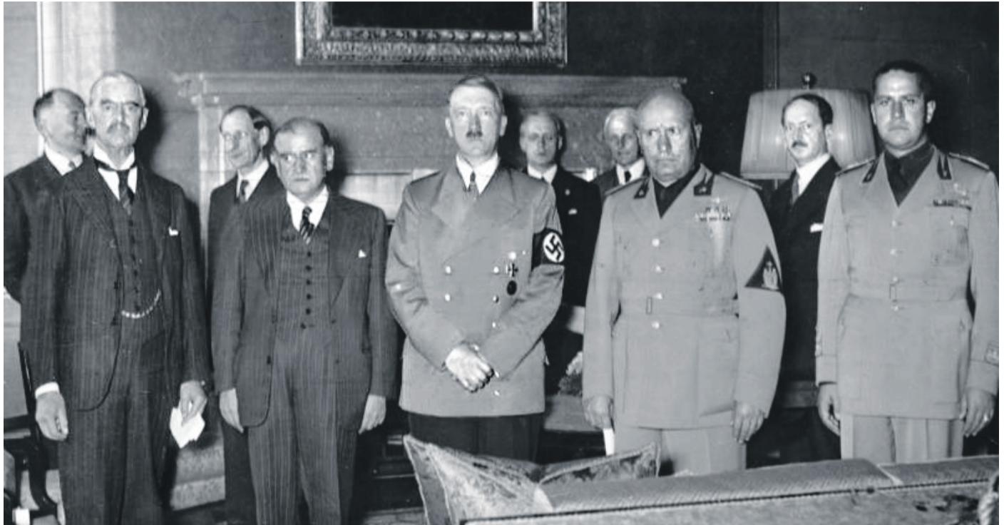
Κλασικό μάθημα της ολέθριας πολιτικής του Κατευνασμού: Το Σύμφωνο του Μονάχου, 29 Σεπ. 1938, που προσέφεραν στον Χίτλερ η Αγγλία και η Γαλλία. Στη φωτογραφία εξ αριστερών ο Άγγλος Πρωθυπουργός, Άρθουρ Νέβιλ Τσάμπερλεν, ο Γάλλος ομόλογός του, Εντουάρ Νταλαντιέ, ο Γερμανός Αδόλφος Χίτλερ, ο Ιταλός Μπενίτο Μουσολίνι κι ο γαμπρός του, Γκαλεάτσο Τσιάνο. Ένα μόλις χρόνο πριν από την έναρξη του Β΄ Παγκ. Πολέμου...

ΗΜΕΡΑ έναρξης του Β΄ Παγκ. Πολέμου θεωρείται η 1η Σεπτεμβρίου 1939. Η ημέρα της εκτόξευσης του Κεραυνοβόλου Πολέμου (Blitzkrieg) της εκ δυσμών εισβολής του Χίτλερ