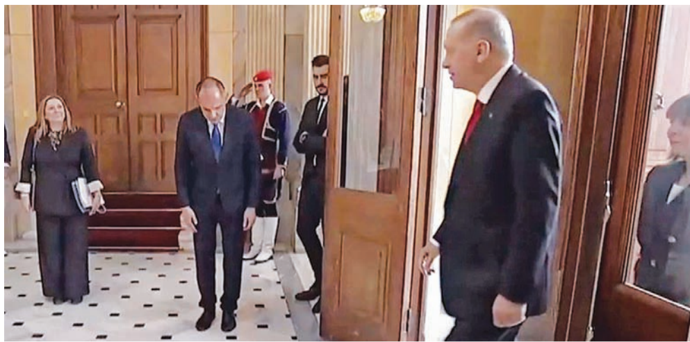
Υποκλινόμενος Γεραπετρίτης προς Ερντογάν κατά την επίσκεψη τού τελευταίου στην Αθήνα, τον Δεκέμβριο 2023. Σάλο είχαν προκαλέσει δύο τέτοια στιγμιότυπα.

«Σε λίγα χρόνια οι Τούρκοι θα κάνουν τους Έλληνες να σκέπτονται σαν Τούρκοι και αυτή θα είναι η μεγαλύτερή μας ήττα».