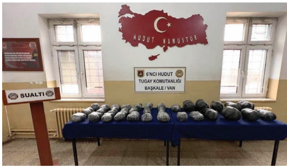
Φωτογραφία του Υπουργείου Εθνικής Άμυνας της Τουρκίας, που δημοσιεύτηκε στις 15.05.2023.

«Σε απλούστερα αγγλικά, και όπως τονίζει ξεκάθαρα η επακόλουθη λεπτομέρεια στην Έκθεση, παρά τη σημαντική δαπάνη των μετρητών [των] φορολογουμένων, δεν θα μπορούσαμε [ως Βρετανοί] να πολεμήσουμε έναν διαρκή πόλεμο με τη Ρωσία του Πούτιν για περισσότερους από μερικούς μήνες πριν μας εξαντληθούν τα πυρομαχικά και οι εξοπλισμοί μάχης, κυρίως επειδή έχουμε ελάχιστα άρματα μάχης, πλοία ή μαχητικά