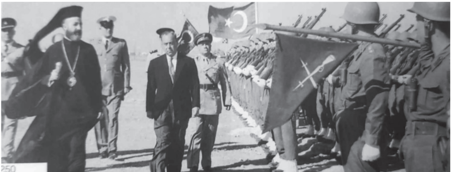
Ο Πρόεδρος Μακάριος, συνοδευόμενος από τον Αντιπρόεδρο Δρα Κουτσιούκ και τον Αρχηγό του Κυπριακού Στρατού, στρατηγό Μενέλαο Παντελίδη, κατά την πρώτη και τελευταία επίσκεψή του στο στρατόπεδο της ΤΟΥΡΔΥΚ, λίγο μετά τον στρατωνισμό της δύναμης στην περιοχή Κολοκόσι. Κατά την επίσκεψή του εκείνη ο Μακάριος προσφώνησε την ΤΟΥΡΔΥΚ με τον χαιρετισμό «Μερ χαμπάρ ασκέρ» (Καλωσόρισε στρατεύμα).